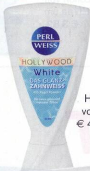
Hollywood White von Perlweiss , € 4,95.

Aufhellende Zahncremes schaden der Zahnoberfläche nicht und beugen neuen Verfärbungen vor.