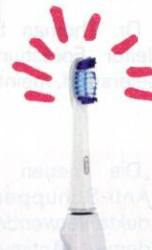
Rotierende, extra-gründliche Pulsonic Schallzahnbürste von Oral-B . Um € 159,99.

Spezielle Bürsten mit Extra-Polierflächen putzen die Zähne auf Hochglanz.