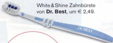
White & Shine Zahnbürste von Dr. Best , um € 2,49.

Spezielle Bürsten mit Extra-Polierflächen putzen die Zähne auf Hochglanz.