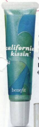
California Kissin' Lipgloss von Benefit , € 19,50.

Blaue Farbpigmente in Gloss oder Lippenstift lassen die Zähne weißer erscheinen.