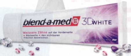
3D White von blend-a-med , um € 1,99.